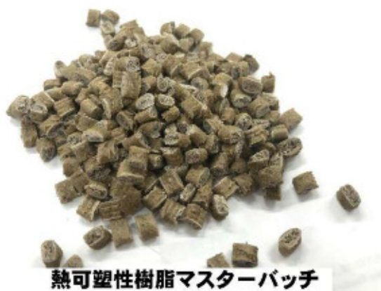
熱可塑性樹脂マスターバッチ