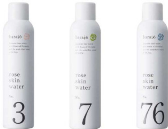
化粧水【ローズスキンウォーター】