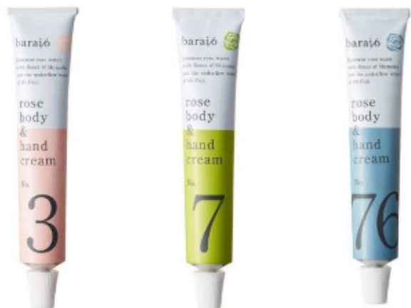
クリーム【ローズボディ&ハンドクリーム】