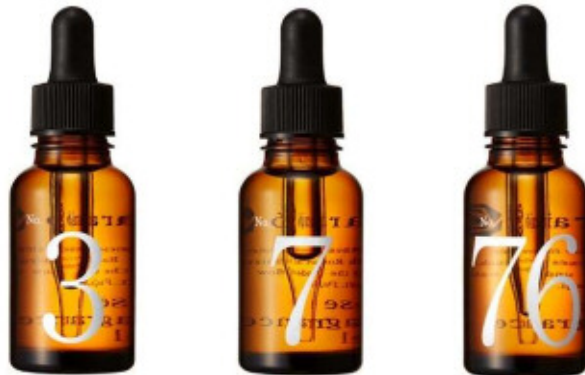
美容液【ローズフレグランスジェル】