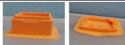
造形物の様子 左：開発組成 右：CNF無添加組成

令和 2 年度富士市 CNF プラットフォーム実用化研究事業にて東洋レチン(株)様と実施したポリプロピレン系 3D プリンターフィラメントの開発に成功しました。この内容は 3/30NHK「おはよう東海」で「富士市の CNF 実用化への取組」として紹介され、反響をいただいております。